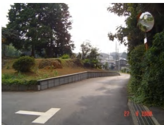
三ヶ島二丁目にて