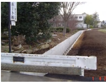
樽井戸川の整備工事が完了しました。