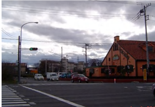
▲ 現在のの上藤沢南交差点

私が一般質問でもたびたび取り上げている上藤沢・林・宮寺間の新設道路につきましては、市長の施政方針の中で