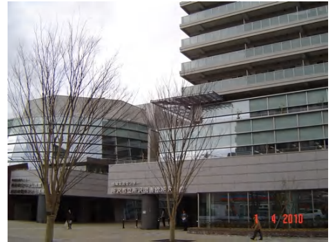
▲商工会議所が入居する所沢ハーティア

平成21年3月定例会において、所沢商工会議所に対し、商工会館(元町北地区に完成した所沢ハーティア東棟3階)取得に要する経費を補助金として、2億6376万3千円交付する予算が計上されました。しかしながら、その後、市執行部が検証を行った結果、床の活用方法、補助金の積算根拠等の一部に疑義が生じたため、市が床の一部を直接取得する内容の議案が当初定例会初日に提出される予定でしたが、会議所の臨時総会にて市からの提案が否決されたことを受け、同議案の提出は取り止めとなりました。そこで、異例の緊急質問も行われました。その後、市と会議所間の協議を経て、新たな積算根拠に基づき、補助率を3分の2として、補助金を2億2577万4千円に減額する内容の議案が定例会最終日に提出され、賛成多数により可決されました。なお、今回の問題をめぐる責任の取り方、処分等について市長は現在のところ明言を避けています。