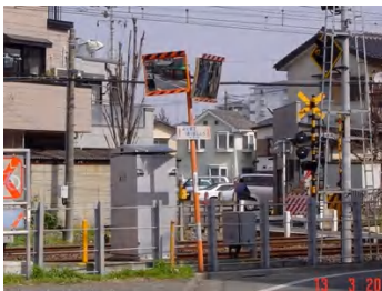
カーブミラーが片面から両面になりました。