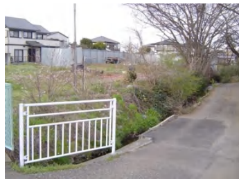
砂川堀沿いの市道の修繕が行われました。