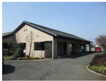
洋式トイレに温式便座が設置されました。