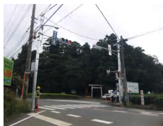
中氷川神社横にて