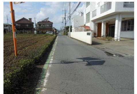
▲ 東狭山ヶ丘3・4丁目にて

亀令園様前の市道において、小さな陥没が生じていたことから、事故防止のため、市道路維持課に対応を依頼したところ、陥没箇所が修繕されました。